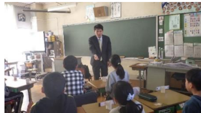
テーマに合わせて弁護士の先生と議論

（納得解）を見付けていく学習です。法教育の観点を取り入れた学習のねらいは「納得解を見付けるスキルを身に付ける」ことで、将来、自らの周りにある課題を解決し、住みやすい、住み続けたいまちにする力の育成をねらっています。本校では、学校内外のトラブルを解決する手掛かりとして、教職員が教育的な視点のみならず、法的な観点からの手立てを考案することができるようにすることや学校生活や社会生活の中で決められているルールやマナーについて、友達とのかかわり、地域とのかかわりという視点で、その意味を児童自ら考えとともに、お互いの納得解を探すためのスキルを身に付けることができるように学習を進めています。具体的な手立てとして、「弁護士さんとの学習から議論の仕方を学ぶ」「弁護士さんと一緒にテーマに沿って議論をし、納得解の見付け方を学ぶ」という活動をカリキュラムに位置付けています。その一つとして、ゲストティーチャーとして現役弁護士の方々に授業参加していただいている4年生の課題解決学習の実践事例（特別活動）を紹介します。