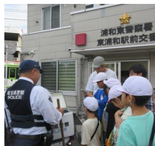
2年生の町たんけん(11月) 駅前交番での一場面

この事業の説明会を本校で行います。期日は2月8日(土)です。事業の概要や申込方法などについては、市のホームページをご覧ください。