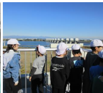
4年生の利根大堰見学(11月) 紙すき体験もしました